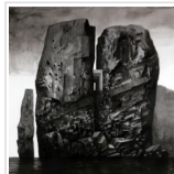
FAXXI 2014: LA FERIA DE ARTE DE LOS ARTISTAS