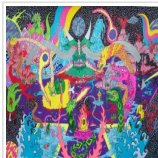
LOS DELIRIOS EXTRATERRESTRES DE MARIO SCORZELLI